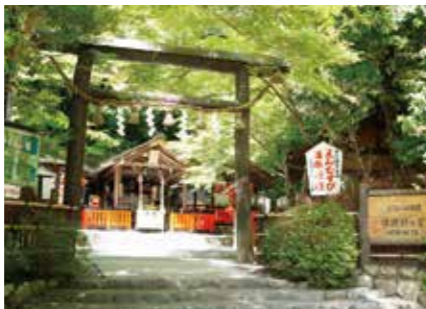
野宮神社 野宮神社

嵐山の象征。在的桥于1934年竣工。因在平安时代，龟山上皇曾咏诗「晴夜月如渡桥弯」，后被称作「渡月桥」。